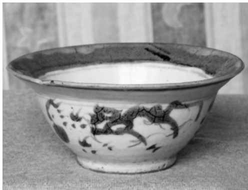
图1 水墨龙纹碗(明清时期)

在色彩上,富有江南气息的纹样很少有艳丽夺目的颜色,多使用少色或单色,主要靠渐变和虚实表现空间和立体的关系。这种质朴的风格正契合了道家的思想。老子对于“素”与“玄”两种无彩色高度重视,不断地提到“素”(“见素抱朴”)和“玄”(“玄之又玄,众妙之门”),素是白色,玄为黑色,即后世水墨依据的颜色,它们与宇宙的本质相连。王维在《山水诀》中还说:“夫画道之中,水墨为上;肇自然之性,成造化之功。” [4]