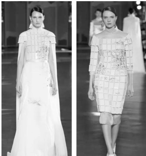
图3 Heaven Gaia 2016 春夏时装