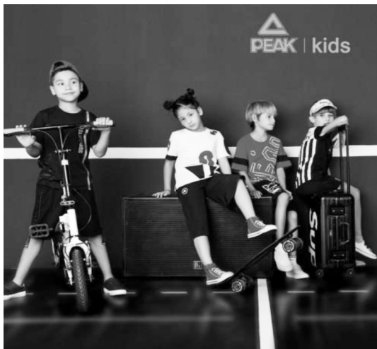
图2 PEAK KIDS 海报