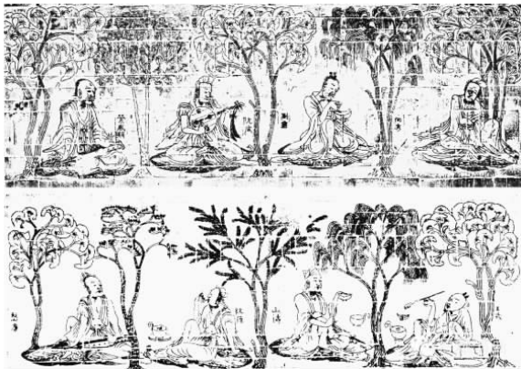
图9 竹林七贤与荣启期画像砖拓片