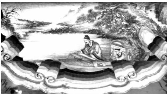
图10 颐和园伯牙摔琴彩绘