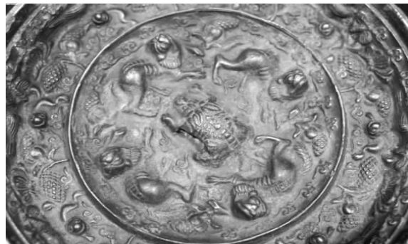
图7 海兽葡萄纹铜镜