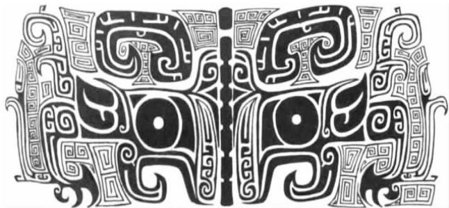
图5 青铜器饕餮纹拓片

的在于为统治政权服务,为统治阶级歌功颂德 [4] 。最典型的代表就是龙、凤及一些祥瑞的造型,这些既是皇家的代表物,同时在装饰上展示出高贵和不可侵犯,并结合了传统的神话故事,体现了统治阶级的地位,因此,在中国漫长的封建社会历史中逐渐形成了这种在传统装饰中的一部分带有浓郁的统治意味的特征。