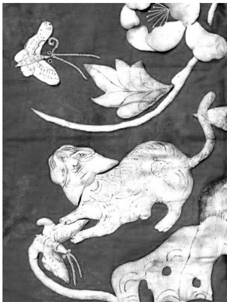
图2 猫与蝴蝶传统刺绣图案