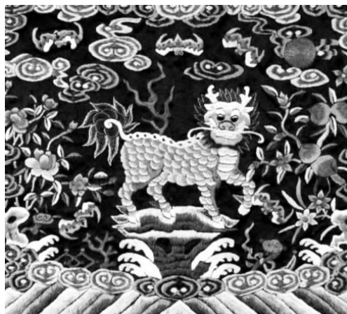
图3 麒麟传统刺绣图案