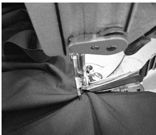
图2 上裤子包边条(拉筒)

除此之外如缝制裤子贴袋等工序,借用模板工具后与传统缝制方法相比同样降低了工艺难度、节省了时间,从而提高了生产效率,企业相应的生产成本也会随之降低。辅助工具的运用对缝制人员的技能等级要求不高,从而降低了生产排位中人员调度的难度。