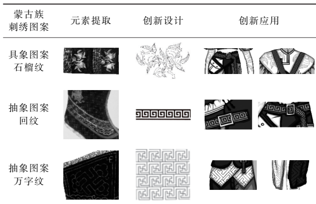
表2 蒙古族刺绣图案的提取及创新设计应用

计方法,在服装风格和民族风格的体现上进行创新,让蒙古族服饰与工装风碰撞出火花,既在传承中创新,又在创新中传承,打造出既具有蒙古族英姿飒爽又符合当下流行趋势的服饰作品——蒙古远征记(图1)。不仅使蒙古族文化得到传承与创新,也让中华民族文化更加多元化。