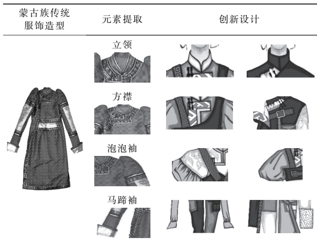
表1 蒙古族袍服的款式提取及设计

款式上延续了蒙古族服饰直身的结构设计,并采用解构设计的方法,在局部细节设计上进行创新,采用上下两件式分割和以腰带为分割的断腰模式,方襟的闭合方式采用盘扣与袷带相结合,泡泡袖用直肩和落肩两种不同的方式夸张肩部,并搭配马蹄袖,将袖子分为2~3节,在廓型设计和款式局部设计上不仅融入现代设计思想还保留蒙古族服饰特点。