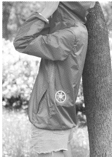
图3 设有空调装置的服装(降温服)

至此,男装基于对男性的社会生存之深度关怀已经呈现出非常明朗的趋势特征——商务功能、保健功能、生活休闲与娱乐功能等各种功能集合一体,多元发展。