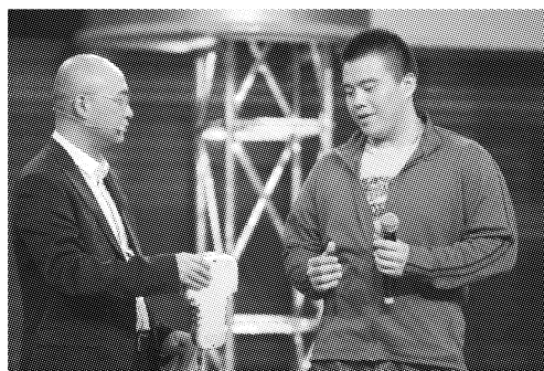
图1 江苏卫视《非诚勿扰》节目男嘉宾着装

类节目《非诚勿扰》中高频出现的休闲时尚和高度个性化的男嘉宾装扮应该能够印证目前正在风行的男装多样化需求的趋势 [1] 。对其2013年3—10月间的70期节目所做分析可知,作为相亲主角,着正装的男嘉宾仅占12.4%;穿着时尚商务类服装的男嘉宾占66.1%;穿着情趣性、个性化服装的男嘉宾占7.2%;穿着时尚休闲服装的男嘉宾占14.3%。主持人孟非则穿着时尚商务型服装主持节目,休闲倾向鲜明。作为传统意义上非常重视礼节性的相亲场面,大家一般都会注重礼服穿着,但在这里礼服却被轻视,甚至会遭到嘲笑,而具有娱乐精神和轻松意识的非主流着装却赢得上位,体现自我的个性化着装也受到追捧(见图1)。这都说明了这个时代的男装潮流在男性自我关照、自我体现及娱乐心情实现新意识的推动下走向了深度多元化。